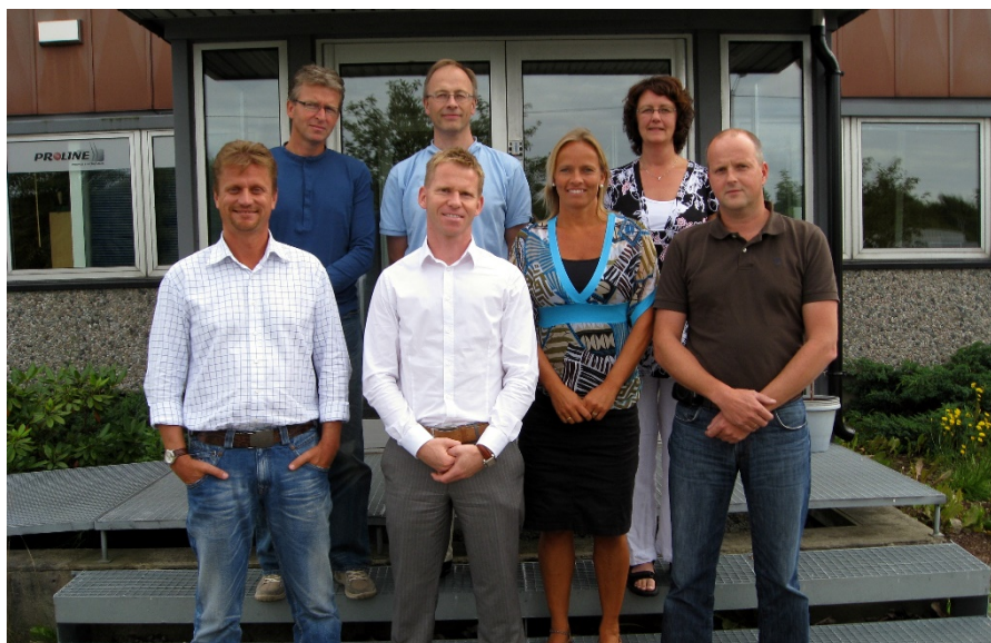
Første styret ved etablering av Østfoldforeningen i 2009